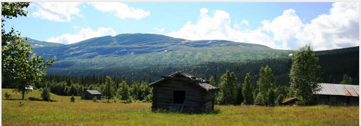
Utsikt mot Ottfjellet från mat- och drickastationen vid Ytterstvallen.

Från Hållfjellet bär det av utför, först på myrmark men snart på smal, teknisk stig med mycket rötter. Vid 26 km planar stigen ut, breddas och blir lättsprungen. Vid 27,1 km når vi den gamla fåbodvallen i Nordbottnen (500 m ö.h.), där en välförtjänt lunch väntar för dem som vill äta.