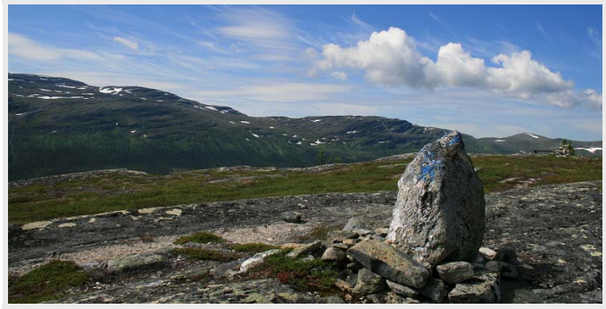
Leden längs åsarna mot Hållfjellet är lättsprungen och bjuder på natursköna vyer.