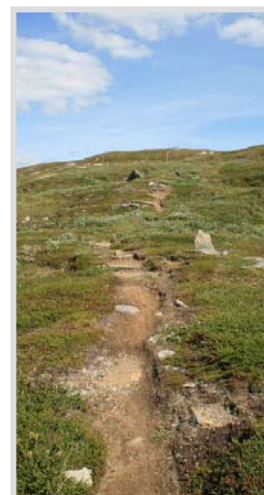
Leden över Välliste är fin och lättsprungna.

Efter att ha njutit av utsikten och rundat toppflaggan fortsätter vi tillbaka ner längs den stig vi kom. Vid greningen följer vi den slingrande, lättsprungna leden söderut, ner mot Ytterstvallan.