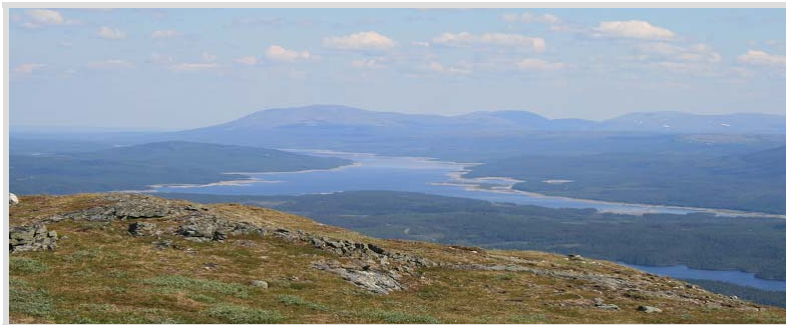
Leden över Välliste passerar 1 km nedanför toppen. Väl uppe på toppen omges vi av storslagna vyer.

Efter att ha njutit av utsikten och rundat toppflaggan fortsätter vi tillbaka ner längs den stig vi kom. Vid greningen följer vi den slingrande, lättsprungna leden söderut, ner mot Ytterstvallan.