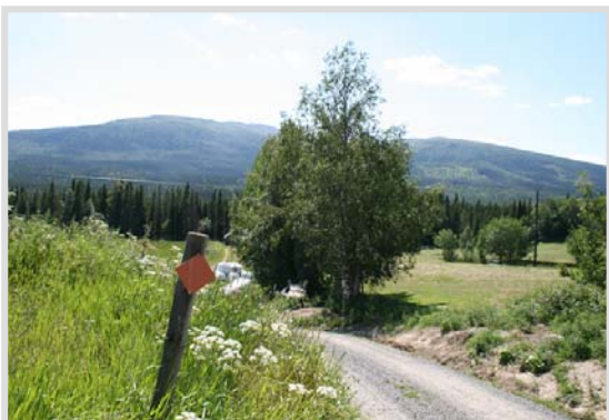
Utsikt över Välliste från starten i Edsåsen.

Den 8:e augusti 2009 arrangeras den femte upplagan av Fjällmaraton. Årets bana blir en upprepning av fjolårets tuffa bana mellan Edsåsen och Vålådalen - en rejäl utmaning som dock uppskattades av de flesta. Banan mäter 43 km, bjuder på hela 1700 höjdmeter och tar löparna över Välliste och Ottfjällets höjder, med storslagna vyer över den jämtländska fjällvärlden.